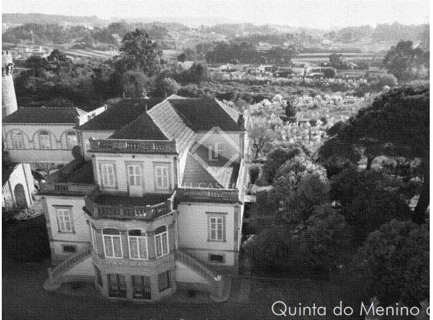
Quinta do Menino d'Água

6 5 1.095m 2 57.000m 2 Slaapkamers Badkamers Plattegrond Perceeloppervlakte