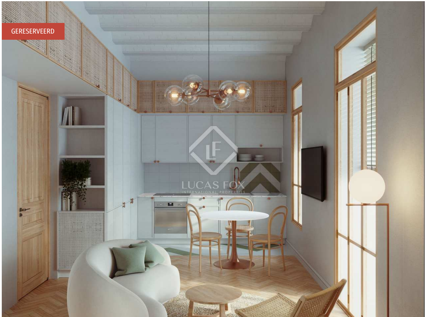
BA24 Calle Buenos Aires 24, Valencia Planta Primera * Vivienda 1.3

2 Slaapkamers 2 Badkamers 82m 2 Plattegrond