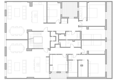
PROPUESTA SEGRIGACIÓN Se plantea en realidad con fines informativos y orientativos para representar una posible segregación interior. No constituye un documento técnico para ejecución de obra, proyecto, licencia, valoración o cualquier otro fin, y no debe utilizarse como base para la toma de decisiones técnicas o jurídicas.

Toepasselijke belastingen (ITP/IVA/AJD), evenals notariskosten, registratiekosten en andere kosten die verband houden met de verkoop, zijn niet inbegrepen in de prijs en zullen door de betreffende partij worden gedragen.