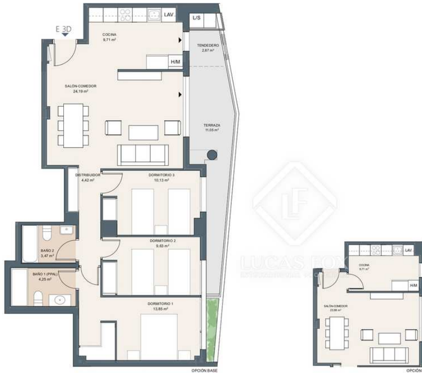
Portal 2. P1-E 3D

3 Quartos 2 wc 106m 2 Plano 11m 2 Terraço