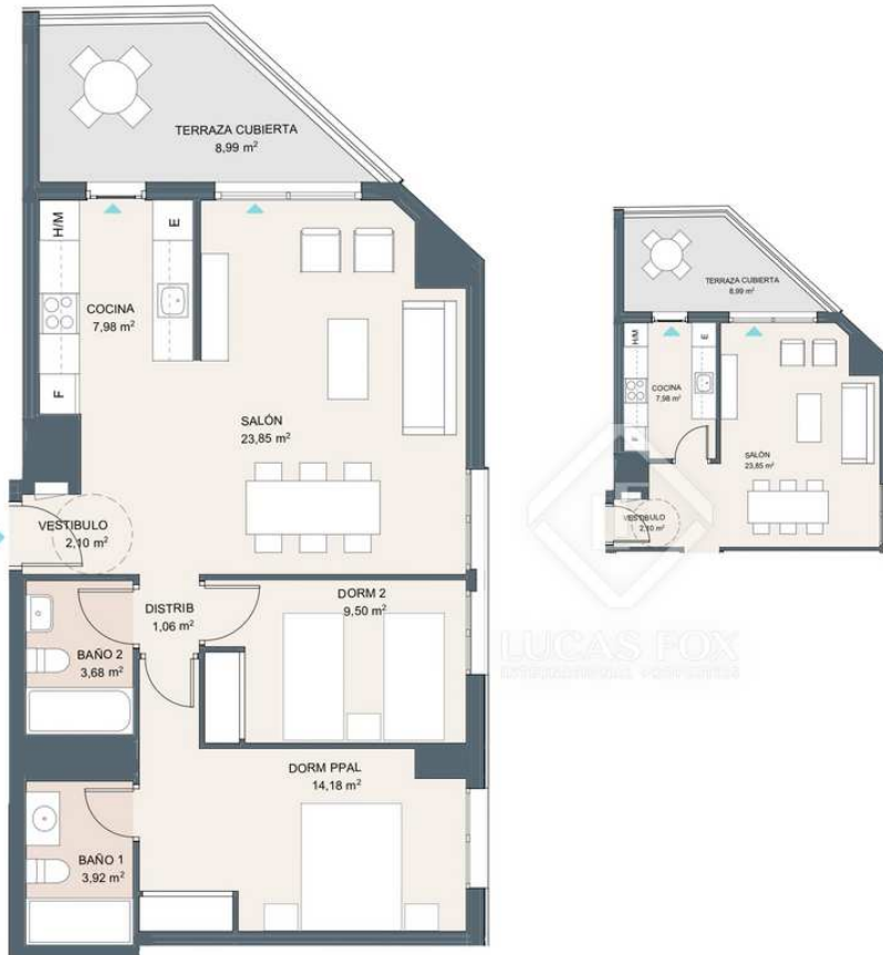
Portal 2. P4-C