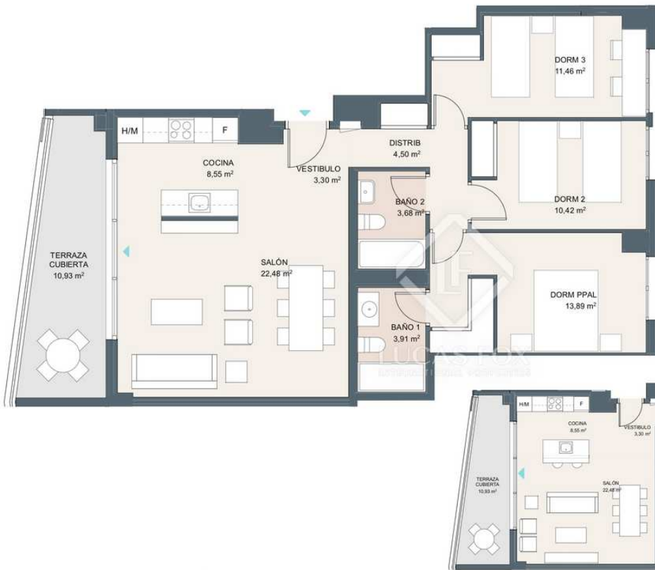
Portal 3. P2-B

3 Quartos 2 wc 113m 2 Plano 11m 2 Terraço