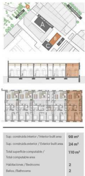
PLANTA BAJA / GROUND FLOOR