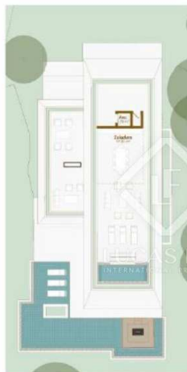
VIVIENDA 5 - Solarium