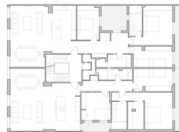
PROYECTO SEGREGACIÓN Este plano se realiza con fines informativos y orientativos para transmitir una posible segregación interior. No constituye un documento técnico para ejecución de obra. Asimismo, cualquier valoración con carácter alguno, y no debe utilizarse como base para la toma de decisiones técnicas o jurídicas.

Dils Lucas Fox (Lucas Trading, SL) está inscrito no Registo de Agentes Imobiliários da Comunidade Valenciana com o número RAICV 4243.