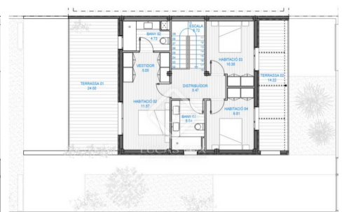
PROJECTE BÀSIC I D'ENDESGUIG D'UN HABITATGE UNIFAMILIAR APARELLAT AMB PISCINA PLÀNOLS D'ARQUITECTURA A.0.