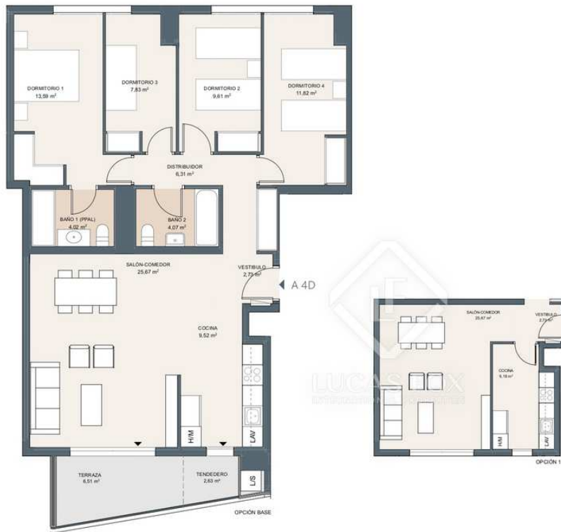
Portal 1. P4-A 4D

4 Спальни 2 Ванные комнаты 124m 2 План этажа 7m 2 Терраса