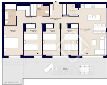
Bloque 1 Esc. 2 P04 B