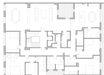
PROPUESTA REFORMA Las plantas se han realizado con fines orientativos y consultivos para representar una posible reforma interior. No constituyen un documento técnico para aplicación de obra, proyectos, licencias, etc., debiendo utilizarse como base para la toma de decisiones técnicas y jurídicas.

Свяжитесь с нами для получения дополнительной информации о данном объекте