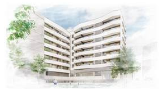
Portal 2. P3-D 3D

Documentación informativa sin carácter contractual y meramente ilustrativa sujeta a modificaciones necesarias por exigencias de orden técnico jurídico o comercial de la dirección facultativa o autoridad competente. Las infografías de las fachadas, elementos comunes y restantes espacios son orientativas y podrán ser objeto de verificación o modificación en los proyectos técnicos. El mobiliario de las infografías interiores no está incluido, los acabados, calidades, colores, equipamiento, aparatos sanitarios y muebles de cocina son una aproximación meramente representativa y el equipamiento de las viviendas será el indicado en la correspondiente memoria de calidades. La certificación energética se corresponde con la establecida en proyecto en trámite. Toda la información y entrega de documentación se llevará a cabo conforme a lo dispuesto en el Real Decreto 1137/1989 y demás normas que pusieran complementario ya sean de carácter estatal o autonómico.