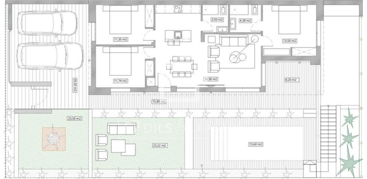
PLOT SIZE: 310.00 m 2 PLANTA BAJA