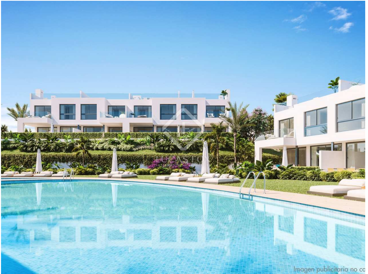
Imagen publicitaria no co

Q3 2024 9 2, 3 & 4 101m 2 Slutförd Enheter tillgängliga Sovrum Storlekar från