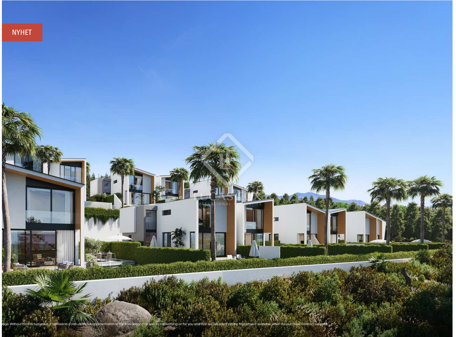
Image Without contractual value. It represents a non-definitive approximation to the final design that we're still working on for you and that we will specify in the final project available when the purchase contract is signed.

3 3 200m 2 80m 2 55m 2 Sovrum Badrum Planlösning Terrass Trädgård