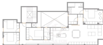
PLANO DE PROPUESTA