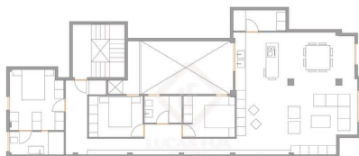
PLANO DE PROPUESTA